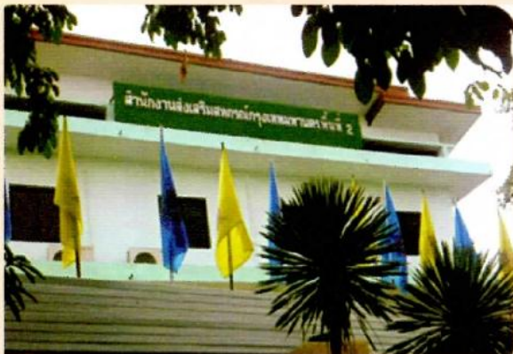
สำนักงานส่งเสริมสหกรณ์กรุงเทพมหานคร พื้นที่ 2 หน่วยงานที่ตรวจสอบกิจการสหกรณ์

"โครงการเงินออมพิเศษสำหรับผู้เกษียณอายุ" เป็นส่วนหนึ่งในโครงการที่สหกรณ์ 05 ได้ดำเนินการมาเข้าสู่ปีที่ 4 และมีเพื่อนสมาชิกเกษียณอายุได้ให้ความสนใจและเข้าร่วมในโครงการนี้เป็นจำนวนมาก โดยปัจจุบันเรามีเงินออมพิเศษจากเพื่อนสมาชิกกว่า 80 ล้านบาท